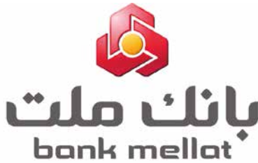
BANK MELLAT - IRÁN